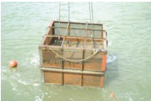
澆置後之混凝土塊拉起

另一方面，標準水中混凝土的試驗配比 No. 3、No. 4、No. 5 的坍流度皆符合要求。空氣含量方面，皆顯示 7 ~ 8% 的高含量。